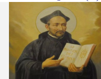
S. Ignazio di Loyola